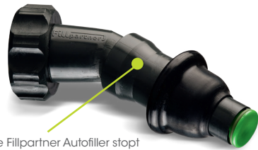
De Fillpartner Autofiller stopt automatisch met vullen.